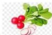
NAKRÁJÍME CIBULKU A ŘEDKVIČKU